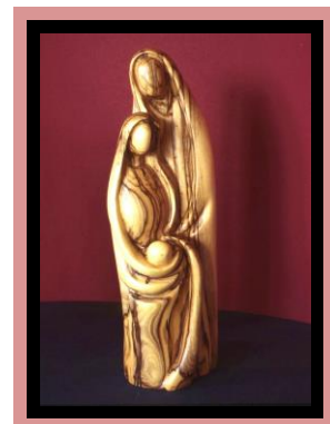
Heilige Familie aus Olivenholz